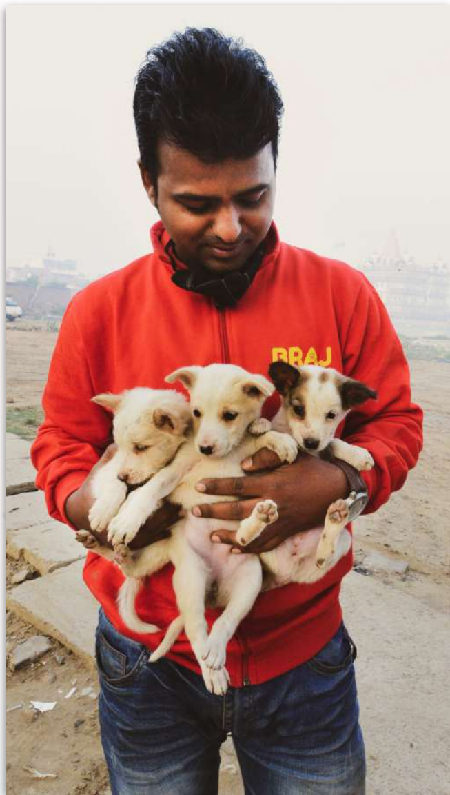
Un miembro del equipo con algunos de nuestros pacientes cachorros

El invierno es la temporada de cachorros en Vrindavan. Nos complace informar que pudimos facilitar varias adopciones. Desafortunadamente, muchos cachorros sin hogar son asesinados o mutilados por conductores negligentes o superados por enfermedades horribles.