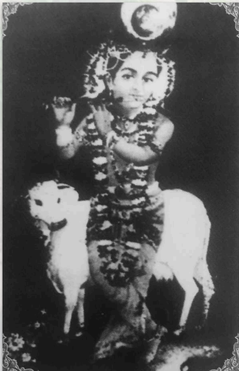
Ma Mani's Gopal

• "Mientras el alma permanezca inmerso en 'yo' y 'mío', seguirá siendo esclavo de la alabanza y la culpa. Pero cuando el se olvida de sí mismo y se entrega completamente a los pies de