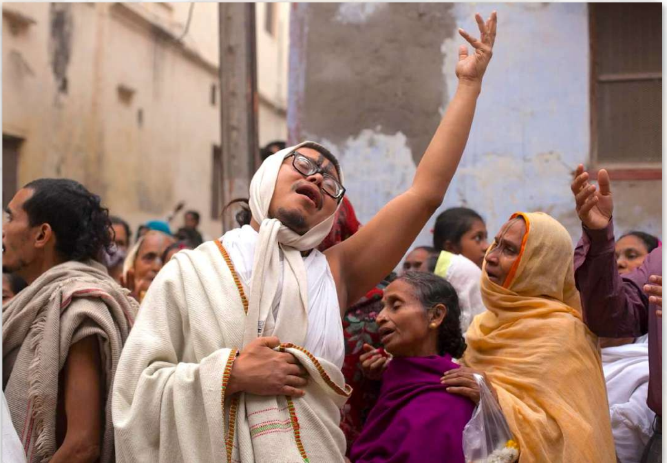
Devotos cantando kirtan como parte de la procesión de Kartik