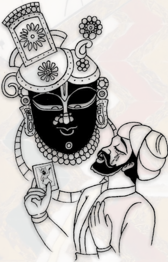
Shrinathji y Raskhan

Un día, dos devotos vieron pasar a Sayed. Uno de ellos susurró emocionado: "¡La pasión de Sayed es tan sincera! ¡No le importa lo que los demás piensen de él y está dispuesto a arriesgarlo todo por su amado! ¡Si tan solo tuviéramos ese tipo de apego por Shri Krishn!" El otro devoto se sorprendió por la idea, dejándolo con una expresión extraña en su rostro.