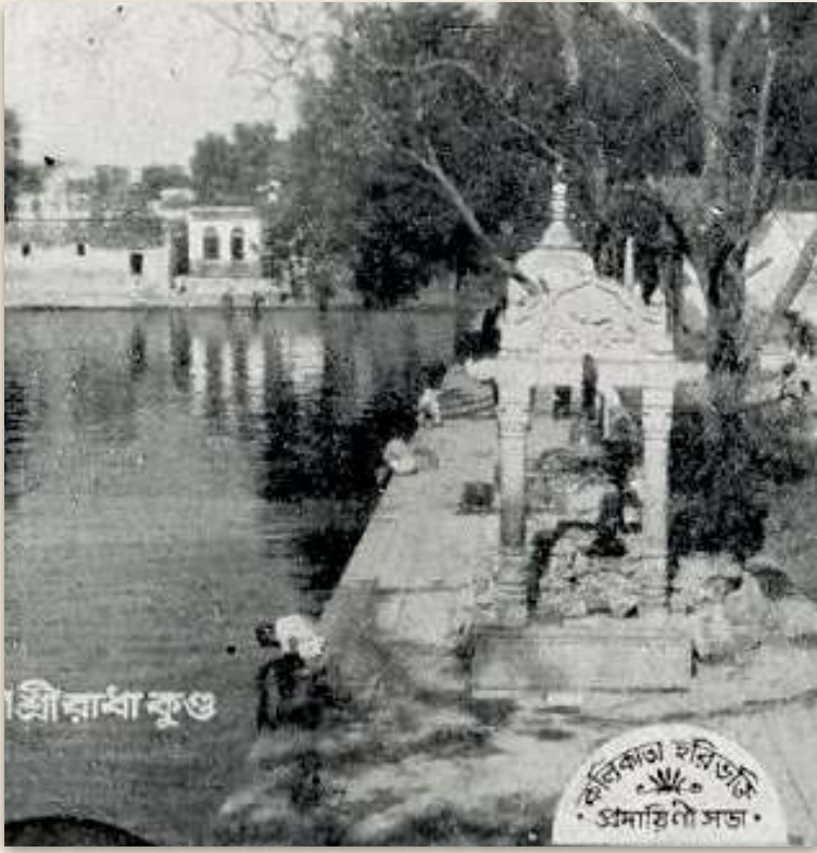
Shri Sangam Ghat en la década de 1970

ella para inspirarlo en su bhajan . Continuó cantando y meditando hasta bien entrada la noche, cuando, sorprendentemente, las mismas dos chicas regresaron de repente. Como antes, se reían y hablaban con entusiasmo, pero ahora podía entenderlas. Hicieron señas a Ramdas Babaji con sus manos de loto y una de ellas dijo: "¡Ven al columpio y deleita tus ojos con la belleza del amor!"