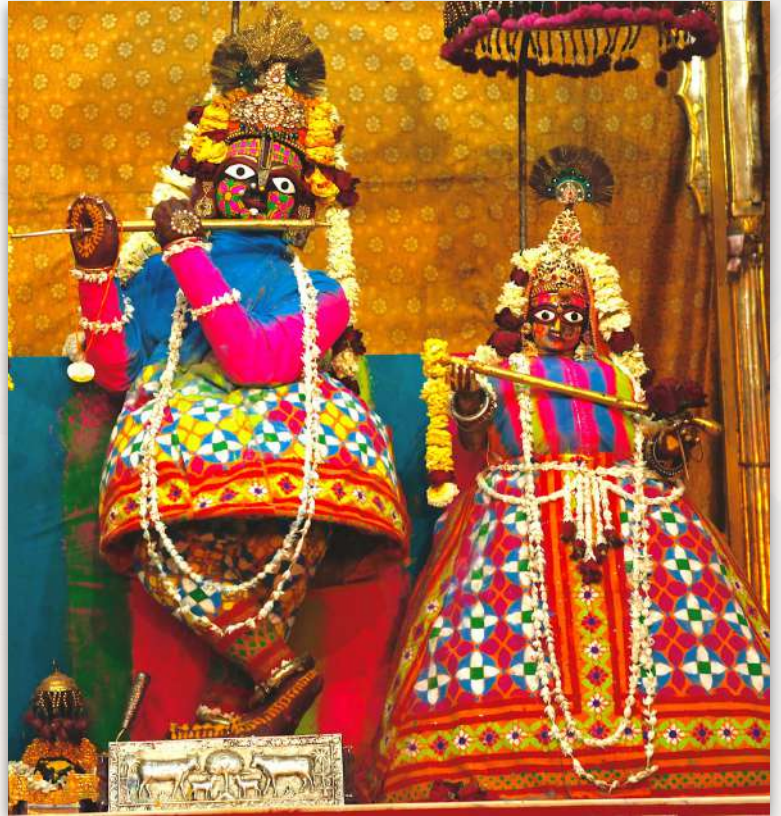
Shri Radha-Govind Dev Ju (Jaipur)

Con respecto al propio Govind Dev, el pequeño Ram Pratap solía pensar: "Este baalak Goswami debe ser el favorito de todos. ¡Por eso lo visten, le hacen el arti y le dan juguetes tan bonitos!"