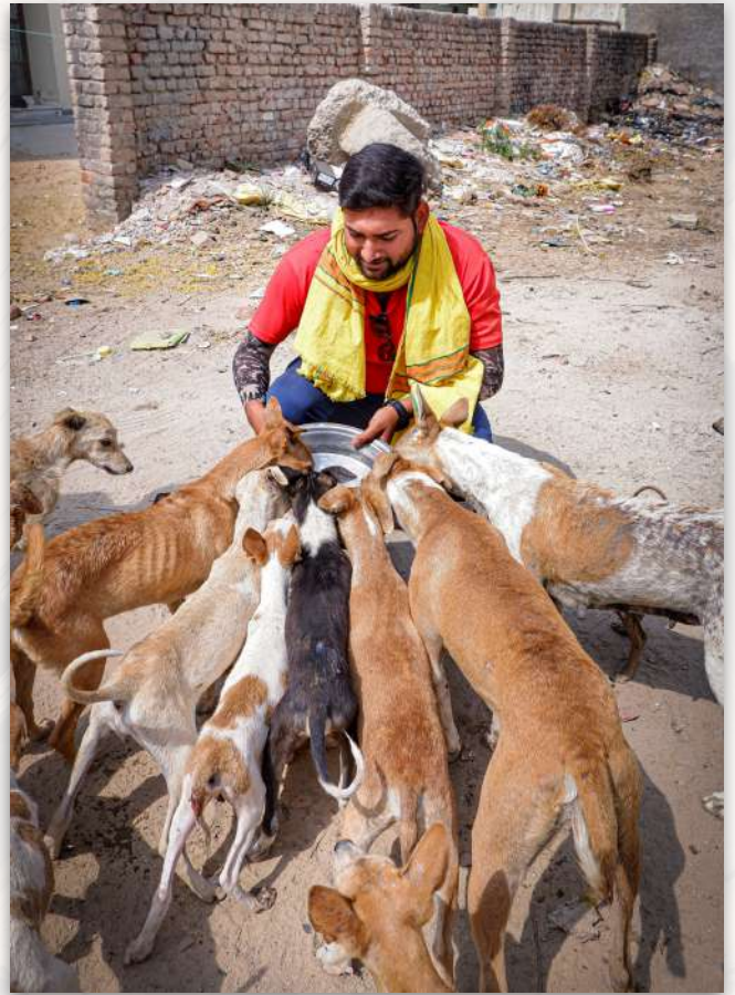
Alimentación de colonias de perros

muchos casos de crueldad animal, lo que puede llevarte a cuestionar a la humanidad misma. Pero situaciones como estas nos dan esperanza y nos recuerdan que a muchas