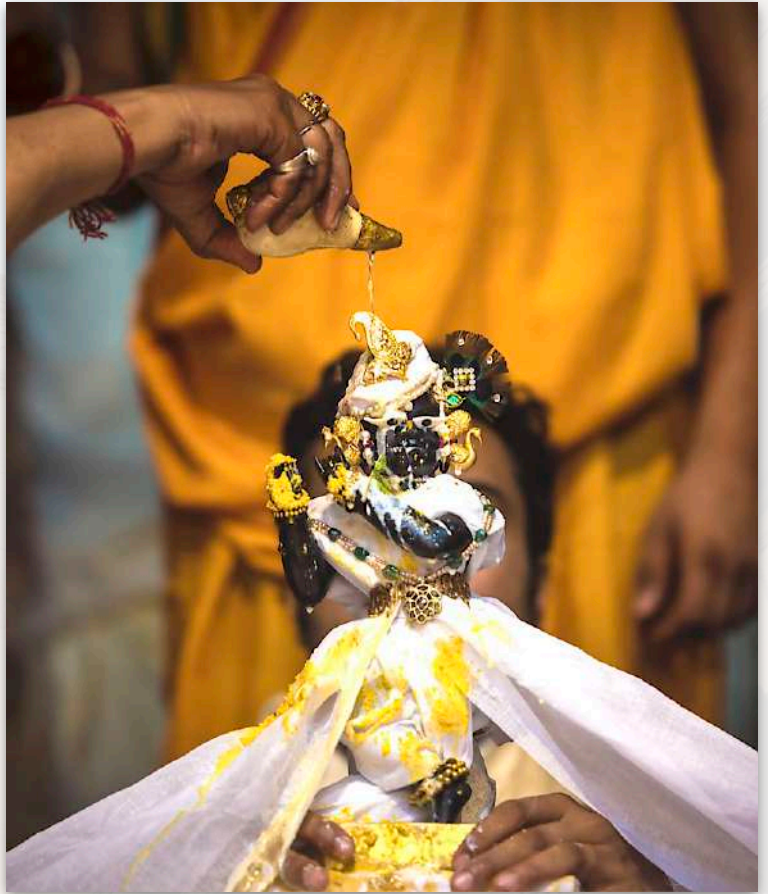
Shri Radharaman Lal

📷 @chandanjiofficial @radharaman.temple 🌐 shriradharaman.com ☎ (+91)8368783201 ✉ odev108@gmail.com