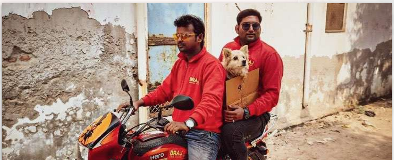
Rambo con Gaurhari (a la izquierda) y Abhijeet (a la derecha)

En un caso particularmente desgarrador, el equipo de Braj Animal Care fue llamado para ayudar a un perro Pomerania adulto que fue encontrado en un montón de basura debajo