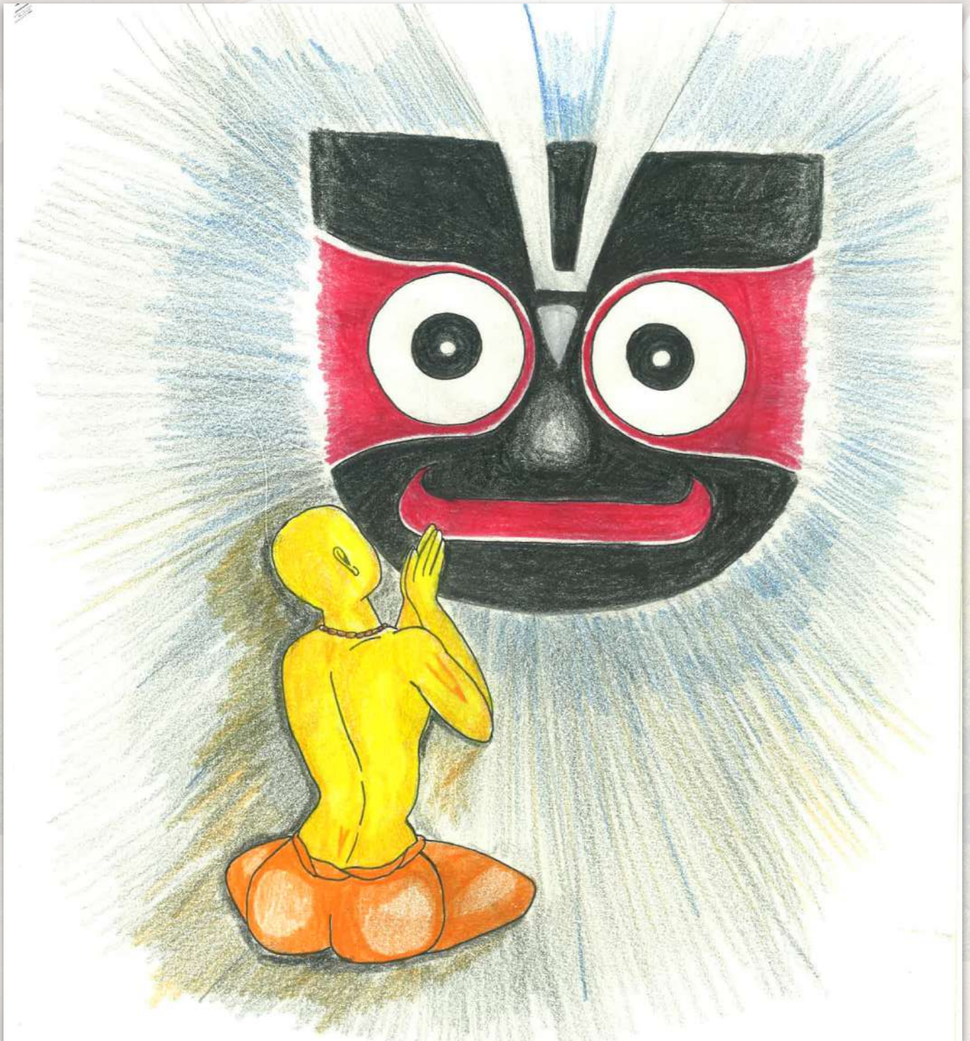
Mahaprabhu entrega sus preocupaciones a Jagannath

Con gran dolor en su corazón, Mahaprabhu fue al templo, donde ofreció todas sus preocupaciones a los pies de loto de Jagannath. En ese momento, la enorme guirnalda de Jagannath cayó de su cuello, y el pujari se la dio a Mahaprabhu. Tomando esto como una señal, Mahaprabhu se llenó de felicidad y regresó a casa.