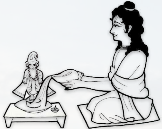
Shrinivas ofrece abhishek

Luego, Jahnava Mata le ordenó a Shrinivas que comenzara el festival de Holi. Se trajeron muchísimos tipos diferentes de polvos de colores fragantes. Después de ofrecer los colores a Mahaprabhu y las otras deidades, las grandes almas se perdieron en el juego de Holi. A medida que se cubrían por completo de colores brillantes, cantaban las canciones del Holi lila 10 de Radha y Krishn.