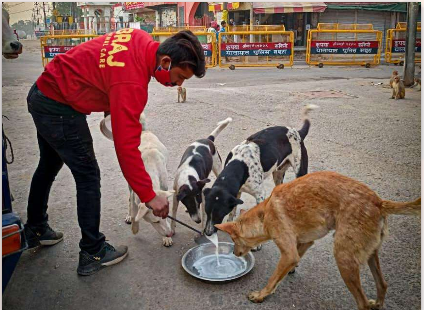
Braj Animal Care alimenta a los animales de la calle a diario