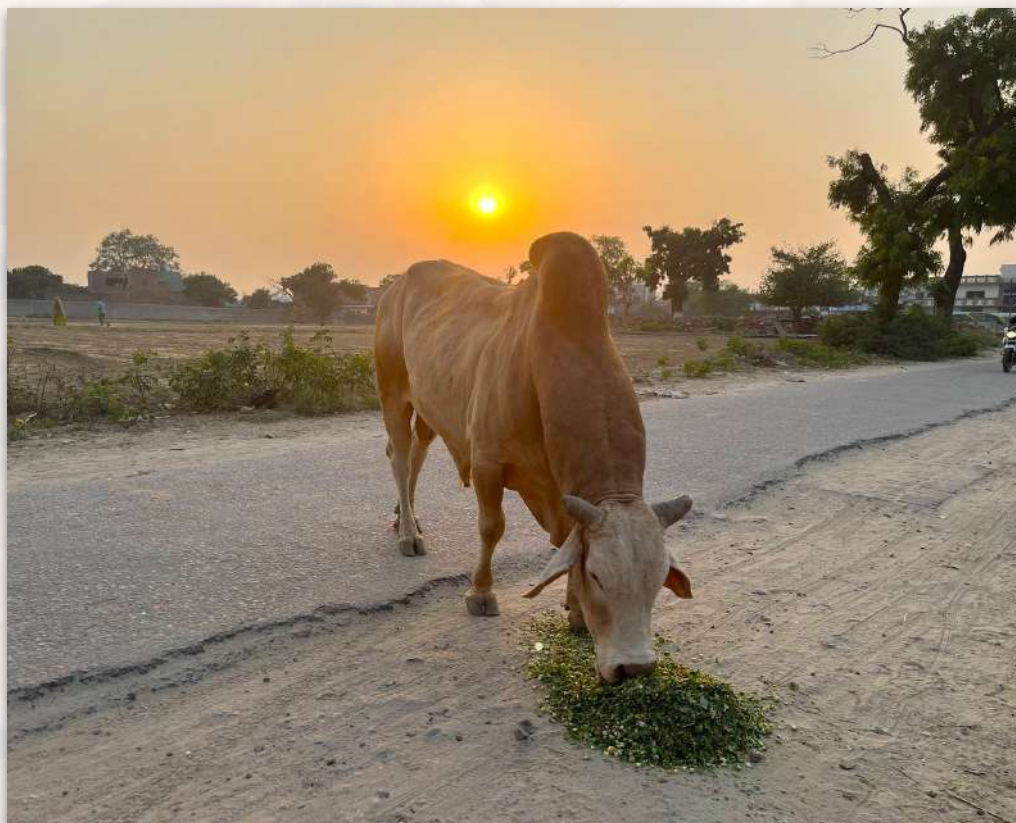
Una vaca Brajwasi disfruta de una alimentación Braj

Benditas sean las vacas de Braj, que sustentan sus vidas en la hierba de las arboledas de Vrindavan. Todos saben que el mismo Krishn camina a su lado y las guía a través de los pastizales. De hecho, cada vaca aquí es el ansh de Krishn (una forma parcial de él). El eterno Vrindavan es su hogar y las divinas Brajwasis de Krishn siempre las acarician con amor. El poeta Nagari Das se siente sumamente afortunado por recibir una gota de su leche como prasad .