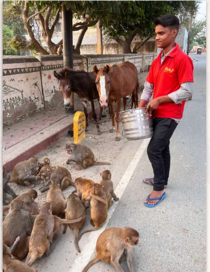
Un miembro del equipo alimentando animales de la

Braj Animal Care sirve a los animales de Braj no solo porque son animales, sino porque son una parte muy especial de esta tierra divina. El poeta Brajbhasha Nagari Dasji ha escrito muchas canciones en su alabanza, tres de las cuales se incluyen aquí: