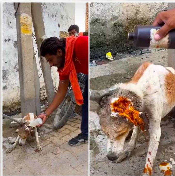
Tratamiento de la herida en la cabeza de un perro

Nuestro compromiso con el cuidado de estos animales es vital. Cada caso es una oportunidad para promover el bienestar animal y destacar la necesidad de mejores servicios veterinarios en lugares como Vrindavan. Al brindar atención médica y abordar las lesiones de manera temprana, podemos mejorar en gran medida la calidad de vida de estos perros vulnerables.