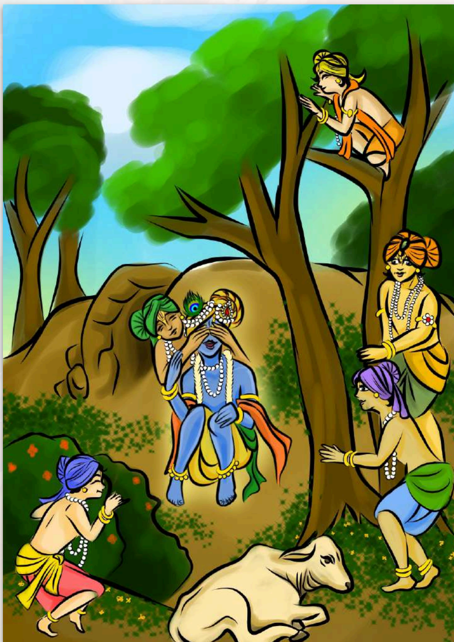
Shri Krishna jugando al escondite con sus amigos

Entonces, un día, en Navadwip, Mahaprabhu recordó de repente que Shridama todavía estaba escondido. Una oleada de emociones divinas lo invadió y comenzó a llorar. Mahaprabhu le pidió a Nityanand que trajera a Shridama a Navadwip para que pudiera ayudar a compartir el Santo Nombre con el mundo.