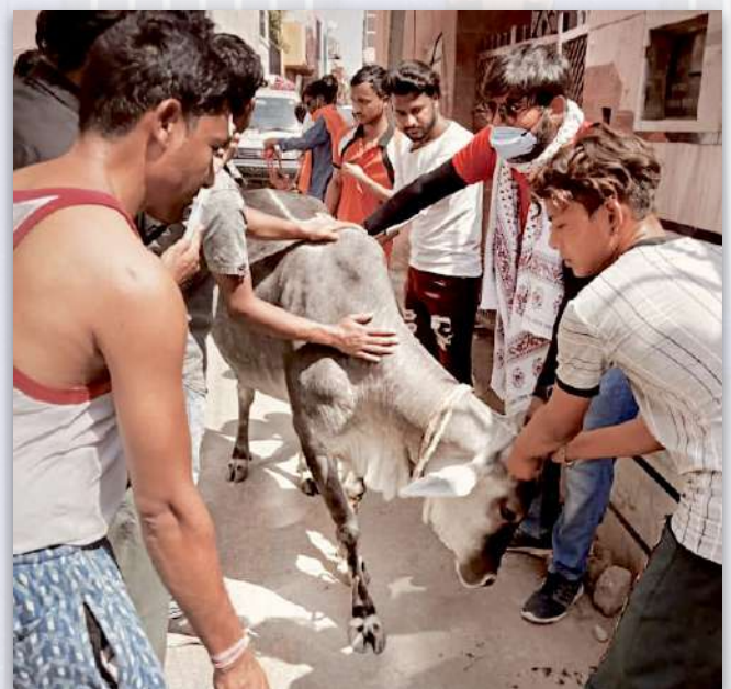
Nuestro equipo y otros locales con la vaca rescatada

Recientemente, el equipo de Braj Animal Care estuvo involucrado en un caso inesperado que involucró a una vaca que estaba atascada en el techo de la casa de un Brajwasi. Había logrado subir una estrecha escalera que conducía al techo, donde se hicieron esfuerzos para llevarla de regreso por las escaleras, pero la vaca tenía miedo y se resistió. Luego, nuestro equipo creó un arnés hecho con cuerdas y con la ayuda de casi 20 lugareños, bajó la vaca por el costado del edificio. Nos complace informarle que no sufrió daños y que está bien.