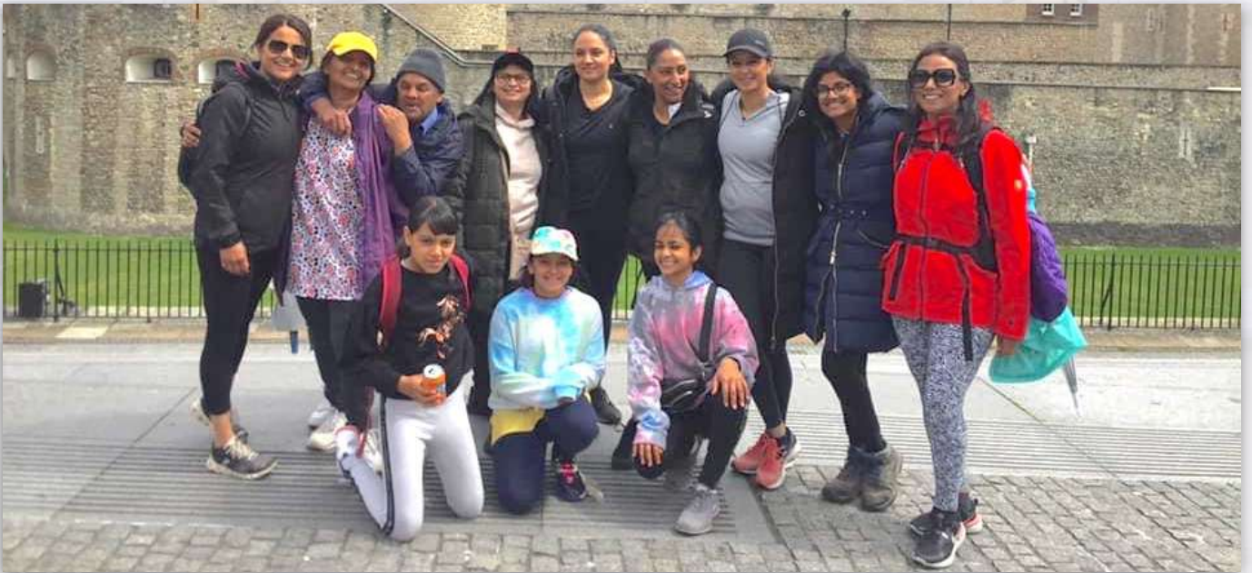
Participantes de la caminata de recaudación de fondos en Londres