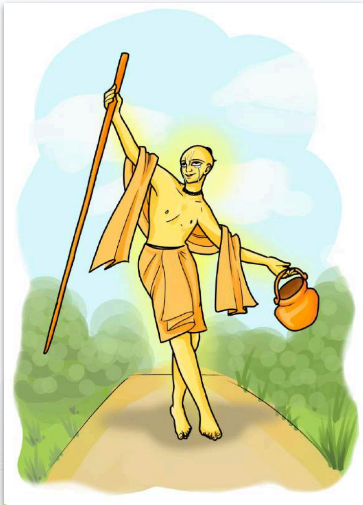
Mahaprabhu en su forma de sannyasi