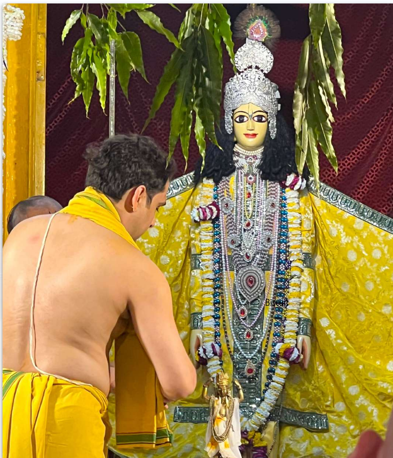
Maharajji sirve a Shri Amiya Nimai Mahaprabhu

Premotsav 2024 comenzó con Maharajji sirviendo a Shri Radharaman Lal en su Nikunj. Shriji estaba bellamente vestido con ropa ligera hecha a mano para asegurarse de que estuviera cómodo en el calor. La velada del Aulai sandarshans traspasó los corazones de todos con amor.