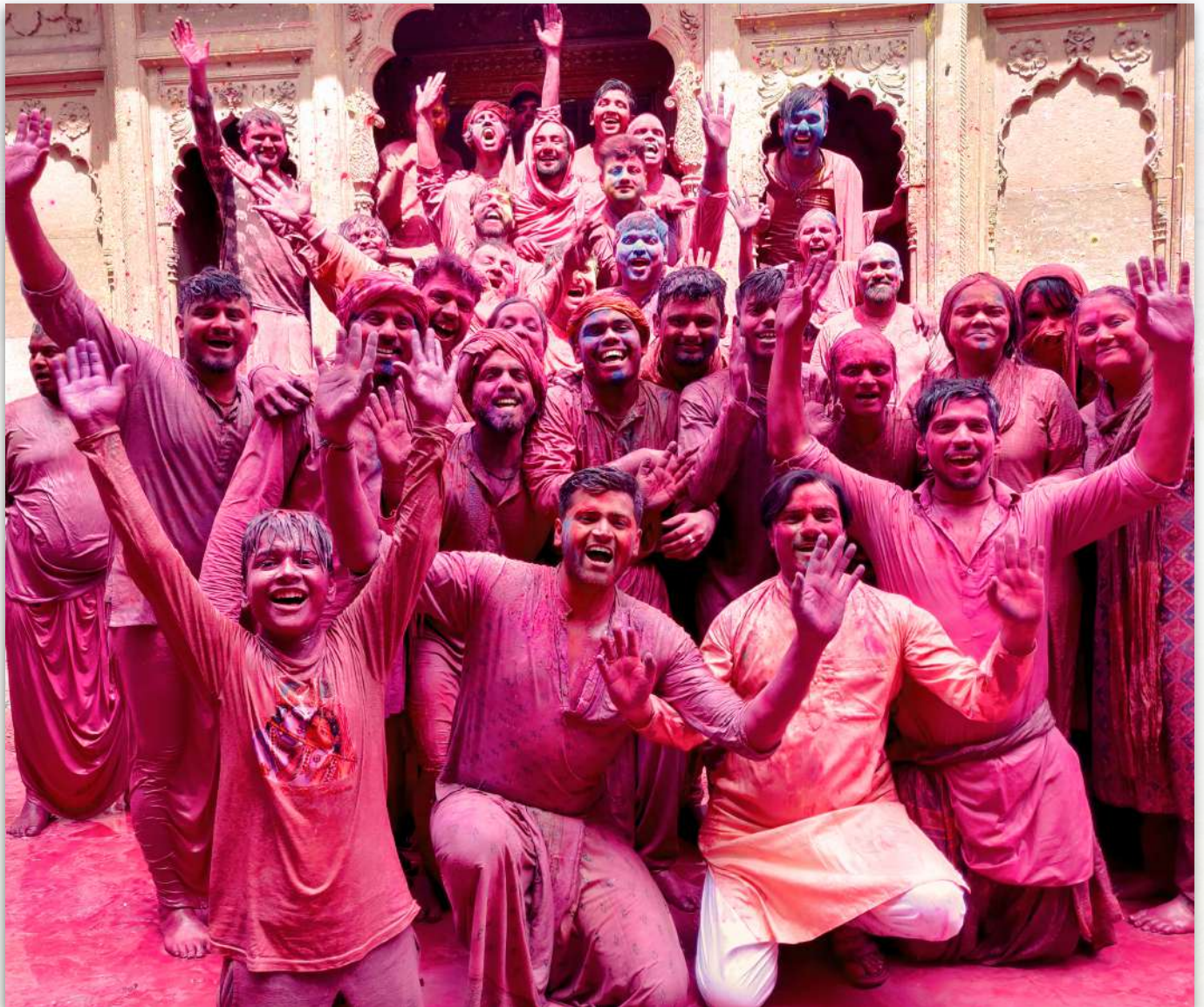
Devotos jugando al Holi en campus del templo de Radharaman

En Gaur Purnima, Maharajji realizó el abhishek de Mahaprabhu en el templo Amiya Nimai en Gopinath Bazar. Este año, el último día de Holi terminó con una celebración floral de Holi en el Raas Mandal con canciones tradicionales de Holi.